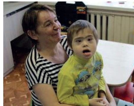
Ребята были рады подаркам

Ты не думаешь о многом, пока тебя это не коснется. А вот ученики нашей гимназии задумались. Задумались и посетили реабилитационный центр для детей и подростков с ограниченными возможностями «Детство». Ребята провели благотворительную акцию «Ты нам нужен!» На протяжении месяца гимназисты и их родители собирали средства на подарки воспитанникам центра. Собранной суммы хватило на множество фломастеров, карандашей и многих других необходимых для развития вещей.